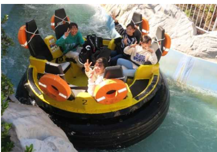
八景島：アトラクション