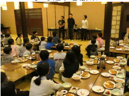
夕食前の爆笑ライブ