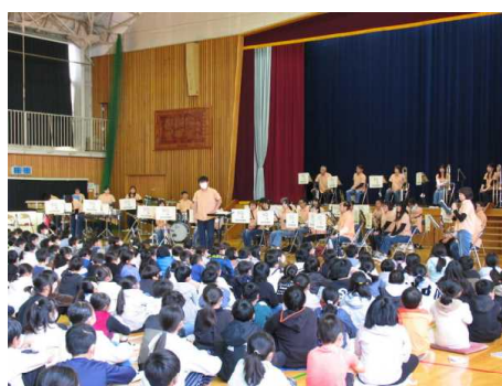
【富岡市民吹奏楽団】

感染力の関係で、保護者や地域の皆様をお招きすることができず、大変心苦しく思います。当日の様子を動画で限定公開いたします。別紙お知らせをご覧ください。