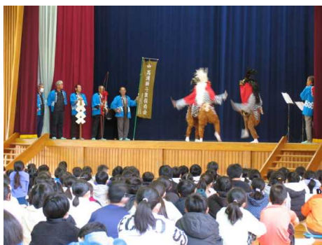
【中高瀬獅子舞保存会】

式典に引き続き、「中高瀬獅子舞保存会」による舞と演奏、「富岡市民吹奏楽団」による演奏と子どもたちの合唱とのコラボレーションを行いました。本物を直接見せていただくことで、魅力と迫力が子どもたちに伝わりました。