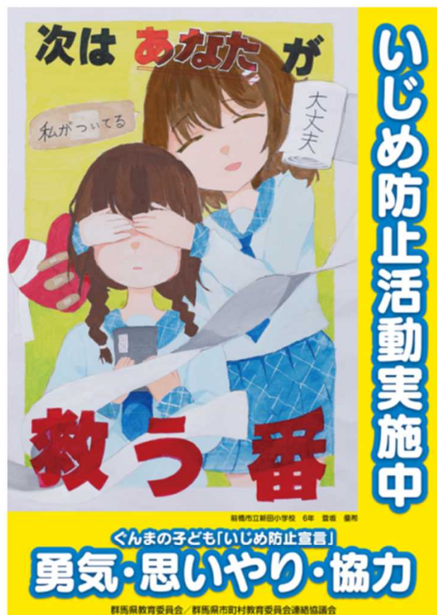
令和5年度（令和4年度最優秀作品）

群馬県いじめ防止宣言【勇気・思いやり・協力】をもとに、いじめを防止していこうとする明るく、前向きで、意欲あふれる作品を募集します！