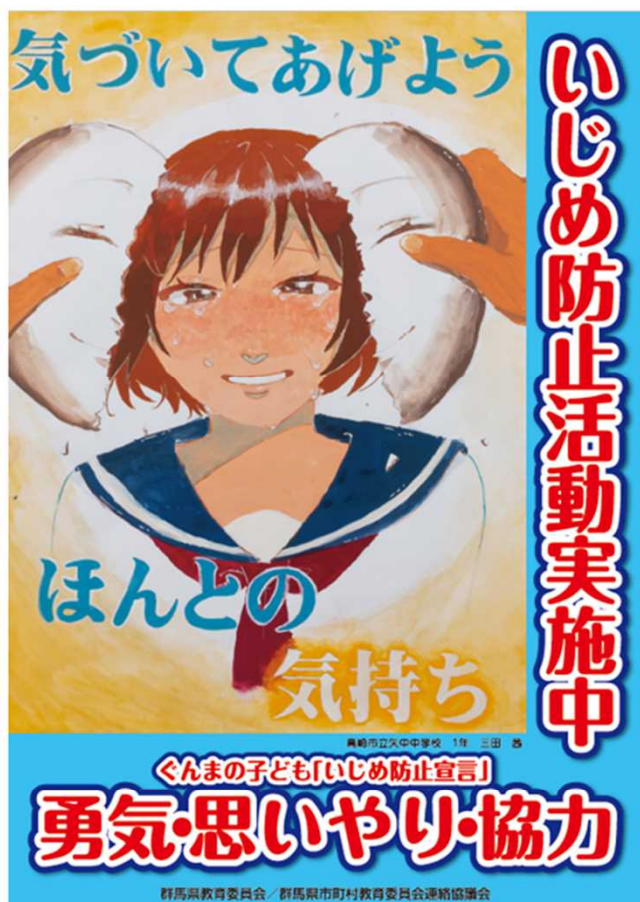
令和6年度最優秀作品