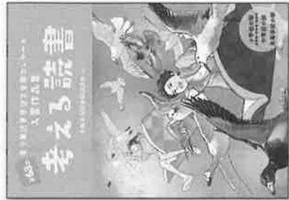
※第69回作品集(昨年度)