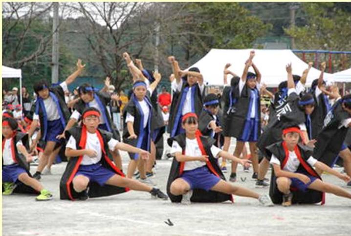
5・6年生「高瀬小ソーラン節」

今回の運動会は、コロナ禍の経験や働き方改革、PTA役員さんの負担軽減を念頭に運営いたしました。保護者の皆様には、応援場所の譲り合いや、徒歩、自転車等での来校に協力してください。ありがとうございました。